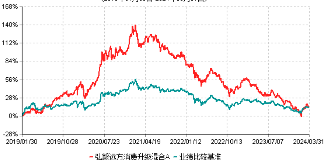
弘毅远方消费升级混合A累计净值增长率与业绩比较基准收益率历史走势对比图 (2019年01月30日-2024年03月31日)